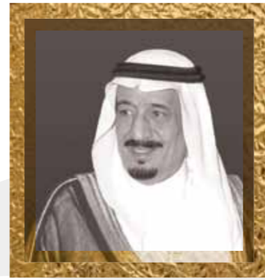
صاحب السمو الملكي الأمير سلمان بن عبدالعزيز ولي العهد نائب رئيس مجلس الوزراء وزير الدفاع His Royal Highness Crown Prince Salman ibn 'Abdul-'Aziz, Crown Prince, Deputy Premier and Minister of Defence