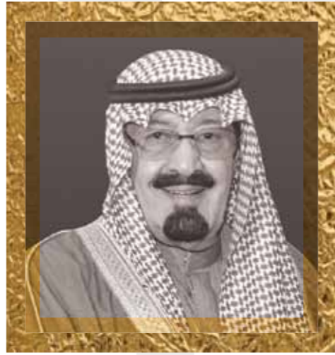
خادم الحرمين الشريفين الملك عبد الله بن عبد العزيز آل سعود Custodian of the Holy Mosques King Abdullah ibn 'Abdul-'Aziz Al Saud