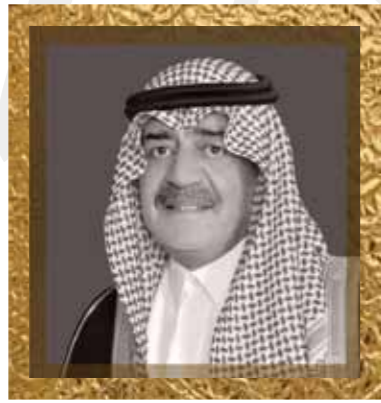
صاحب السمو الملكي الأمير مقرن بن عبدالعزيز النائب الثاني لرئيس مجلس الوزراء His Royal Highness Prince Miqrin ibn Abdul-'Aziz, The Second Deputy Premier