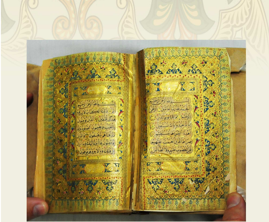
نسخة كاملة: كتبها السيد الحافظ محمد الوفا في سنة ١٢٤٥هـ بخط نسخ جميل، على ورق أصفر، وهي مزخرفة ومذهبة الإطار، عدد أوراقها ٤٦١ ورقة، وعدد أسطرها ١٣ سطراً، ومقاسها ١٦×١١سم، ورقمها العام بالمكتبة (٩).