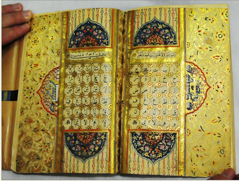
نسخة جزء ألف باء: كتبها محمد صالح الأسكداري بخط نسخ جميل في سنة ١١٩٧هـ على ورق أصفر، وهي مزخرفة ومذهبة الإطار، عدد أوراقها ١٩ ورقة، وعدد أسطرها ٦ أسطر، ومقاسها ١٥ × ٢٠,٥ سم، ورقمها العام بالمكتبة (٦).