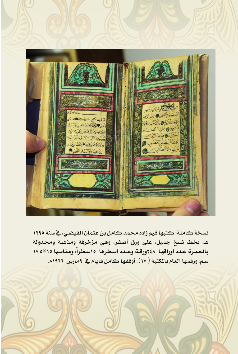
نسخة كاملة: كتبها قيم زاده محمد كامل بن عثمان الفيضي، في سنة ١٢٩٥ هـ، بخط نسخ جميل، على ورق أصفر، وهي مزخرفة ومذهبة ومجدولة بالحمرة، عدد أوراقها ٢٤٨ ورقة، وعدد أسطرها ١٥ سطراً، ومقاسها ١٥×١٧.٥ سم، ورقمها العام بالمكتبة (١٧). أوقفها كامل قايام في ٩ مارس ١٩٦٦ م.