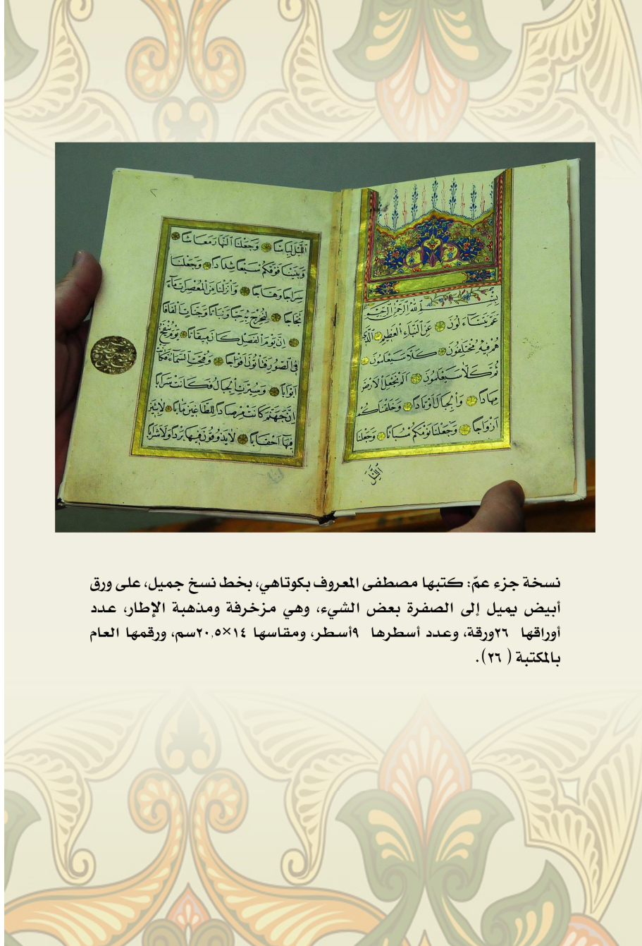
نسخة جزء عم: كتبها مصطفى المعروف بكوتهافي، بخط نسخ جميل، على ورق أبيض يميل إلى الصفرة بعض الشيء، وهي مزخرفة ومذهبة الإطار، عدد أوراقها ٢٦ ورقة، وعدد أسطرها ٩ أسطر، ومقاسها ٢٠,٥×١٤ سم، ورقمها العام بالمكتبة (٢٦).