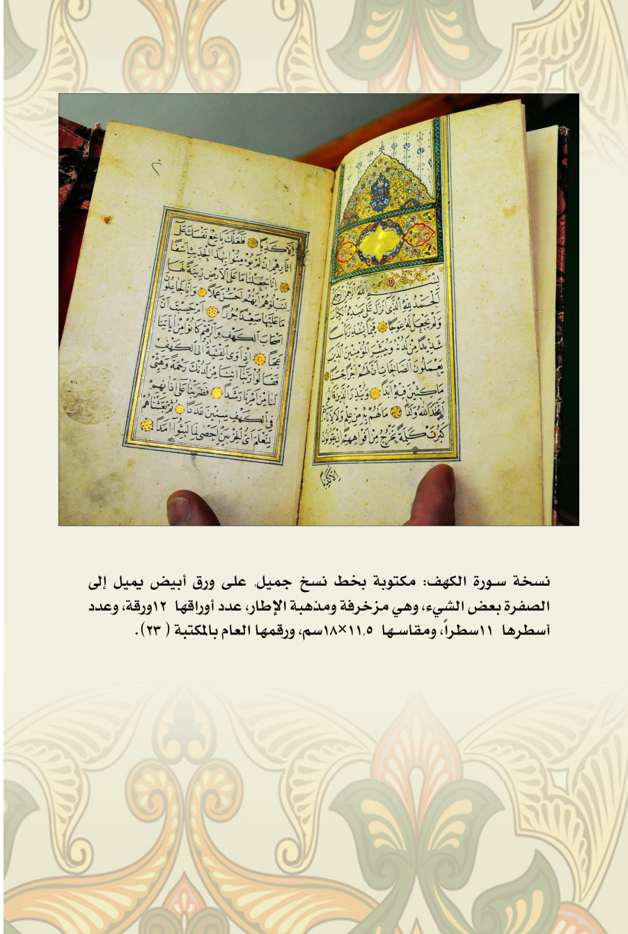
نسخة سورة الكهف: مكتوبة بخط نسخ جميل على ورق أبيض يميل إلى الصفرة بعض الشيء، وهي مزخرفة ومذهبة الإطار، عدد أوراقها ١٢ ورقة، وعدد أسطرها ١١ سطراً، ومقاسها ١٨×١١.٥ سم، ورقمها العام بالمكتبة (٢٣).