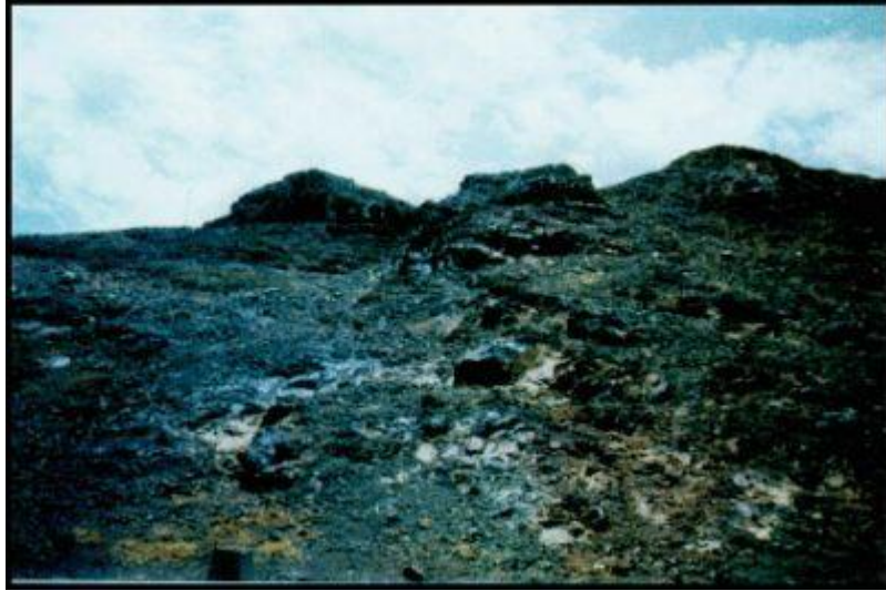
شكل (٥) صورة جبل سلع في المدينة المنورة

وقيدار كما ورد في النص هو أحد أبناء إسماعيل كما جاء في سفر التكوين الإصحاح الخامس والعشرون العدد الثالث عشر وتشير لمكة المكرمة. وسالع جبل سلع في المدينة المنورة . والترنم والتهافت ذلك الأذان الذي كان ولا يزال يشق أجواء الفضاء كل يوم خمس مرات ، وذلك التحميد والتكبير في الأعياد وفي أطراف النهار وأثناء الليل كانت تهتف به الأفواه الطاهرة من أهل المدينة الطيبة الرابضة بجانب سلع.