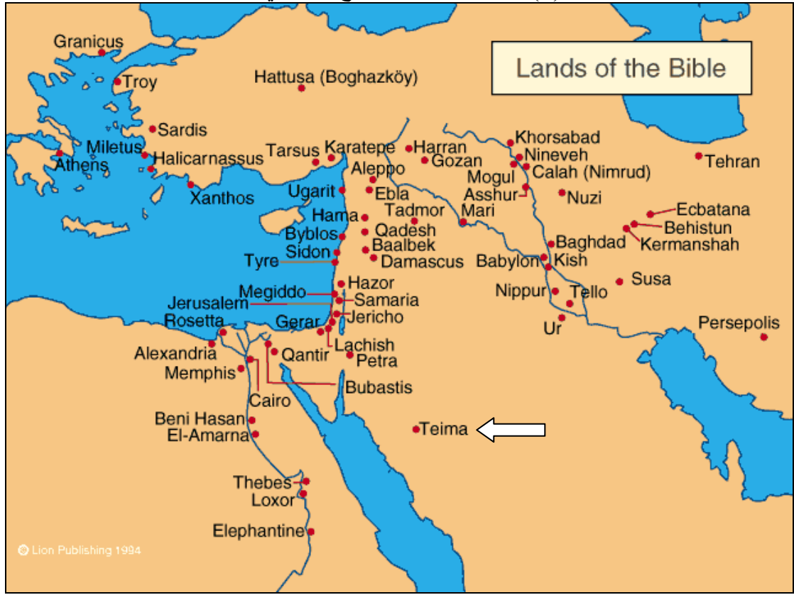
شكل (٢) خريطة تيماء من موقع نصراني معتمد ١ :

http://www.painsley.org.uk/re/Atlas/lands.gif ١