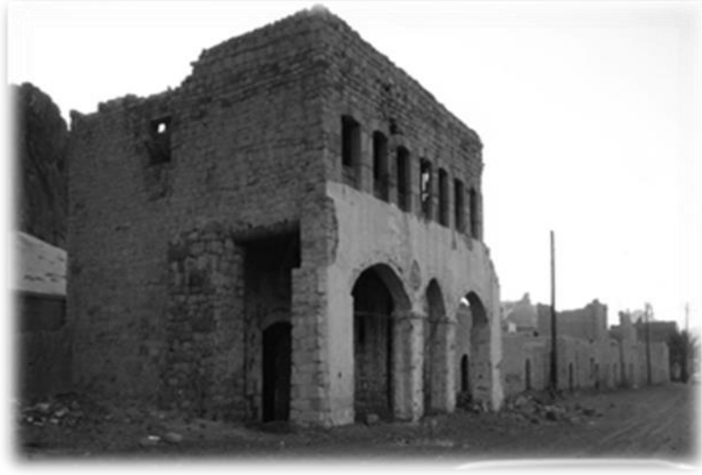
جزء من واجهة المدينة من الناحية الغربية