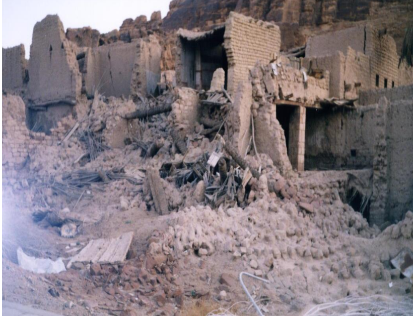
التهدم الكبير في بعض نواحي المدينة

والمواطن الواعي بدور وأهمية التراث العمراني في حياته سيجعله يبادر إلى المساهمة في صيانتته ، أو التنازل عنه مقابل المحافظة عليه .