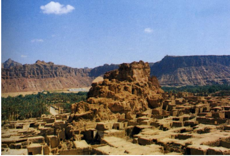
البلدة القديمة في العلا

جذوع النخيل أو الأثل ، وبعد ذلك يفرش الخوص ، ثم يغطى بالطين المبلل بالماء ، مع شيء من الانحدار ليسهل تصريف مياه الأمطار . وقد شكل تلاصق البيوت وتداخلها سوراً يحيط بالبلدة من جميع الجهات ، بحيث لا يمكن أن يدخل إلى البلدة إلا من خلال بوابات معلومة يطلق على كل واحدة منها صوراً (١) جمع أصور ، وعدد هذه الأصور أربعة عشر صوراً ( أي باباً ) تفتح على أزقة متعرجة تؤدي للمنازل ، تقفل ليلاً وتفتح عند الصباح .