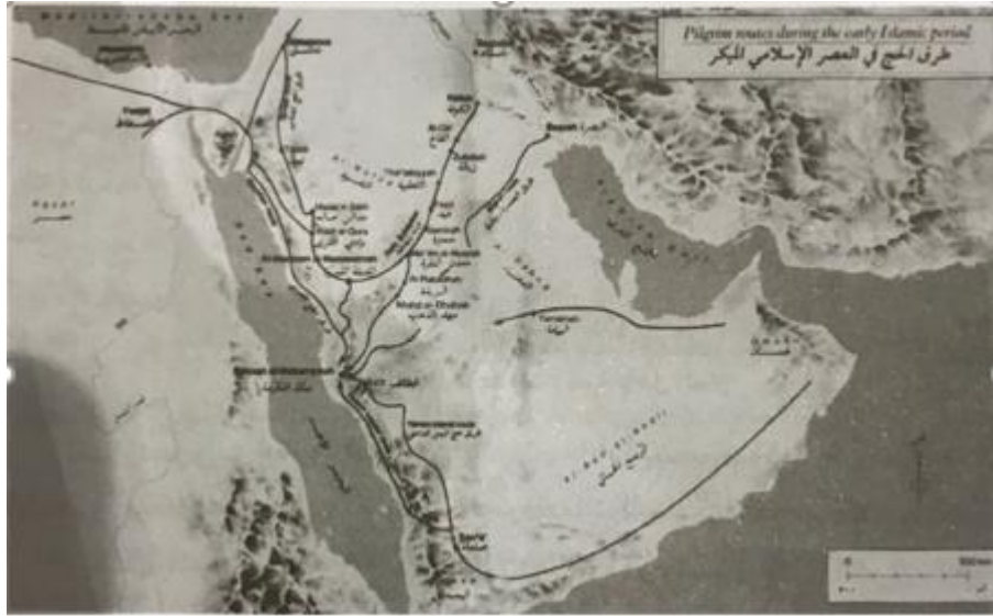
طرق الحج في العصر الإسلامي المبكر ( نقلاً عن كتاب ( الريذة ) لسعادة الدكتور سعد الراشد - جامعة الملك سعود - الرياض )